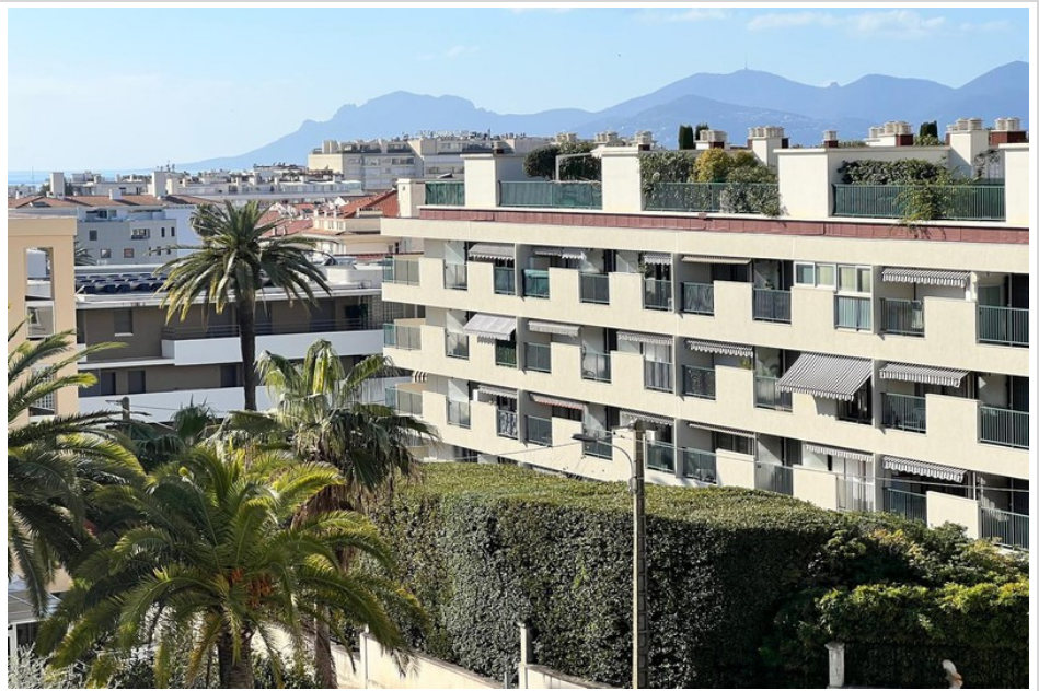
Apartment 1236 Cannes